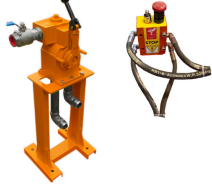
Mando con Parada de Emergencia Separados del Winche (5 metros)