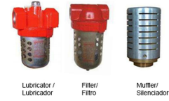
Lubricator / Lubricador